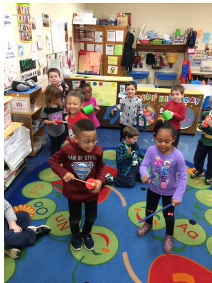
Los niños en Jones 5 están haciendo música usando todo tipo de objetos creativos..