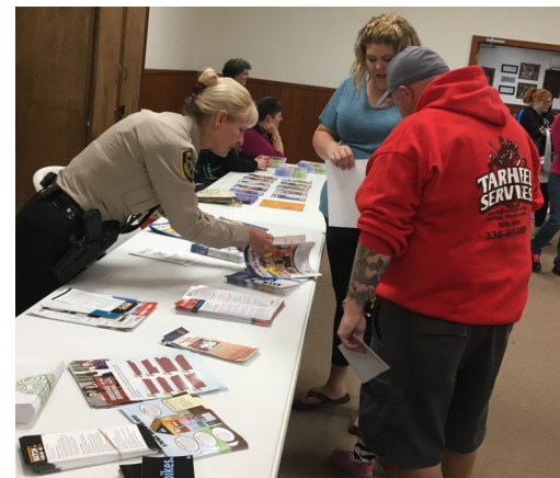
Gracias al Deputy Díaz por proporcionar a los padres información valiosa en nuestro taller del Condado de Yadkin.